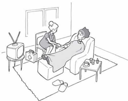
پرستاری و مراقبت در خانه

در زمان بیماری، تصادف، دوره نقاهت، دوران حاملگی سخت و یا پس از زایمان میتوان از خدمات اشپیتکس استفاده نمود. کمک و یاریه بستگانی که نیاز به پرستاری و مراقبت دارند و یا کارهای خانه، یکی دیگر از خدمات اشپیتکس میباشد. تهیه و تدارک نهار و شام، خدمات مختلف پزشکی، در صورت احتیاج رانندگی (رساندن بیمار به پزشک یا بیمارستان) بعلاوه در اختیار گذاردن لوازم کمکی مانند: چوب زیر بغل، دستگاه های بخور یا صندلی چرخدار و غیره بخشی از خدمات اشپیتکس می باشد.