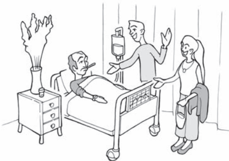
ملاقات در بیمارستان