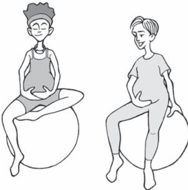
در کورس آمادگی زایمان

در سوئیس میتوانید در بیمارستان بطور اضطراری stationär یا مستقری ambulant، در خانه و یا در خانه های مخصوص زایمان Geburtshaus وضع حمل کنید. نام نویسی و معرفی شما برای زایمان توسط پزشک صورت میگیرد. در اغلب موارد میتوانید شخصاً تصمیم بگیرید، در کدام از این مراجع مایل به وضع حمل میباشید. در ضمن میتوانید راجع به طریق و انواع گوناگون زایمان کسب اطلاع نمائید.